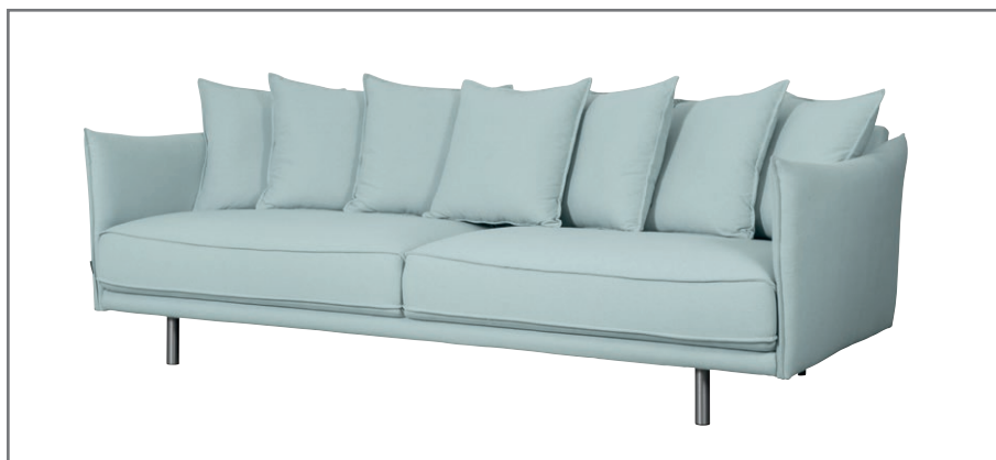
Phoenix 3 Night