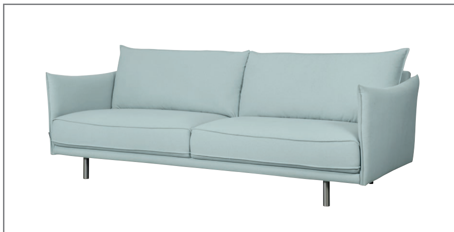
Phoenix 3 Day

Ekstrawagancki sznyt sofy nadaje specjalny szew tzw. francuski. To interesujące przeszycie jest swoistym wyróżnikiem tego mebla i sprawia, że wnętrze nie jest nudne. Poza walorami estetycznymi, sofę cechują wygoda i ergonomia, osiągnięte dzięki doskonale wyprofilowanym podłokietnikom, siedzisku i dużym, dopasowanym poduchom. To wszystko udało się zgrać w kompaktowej, lekkiej formie, dlatego też Phoenix to propozycja idealna do mieszkań, nawet tych o niewielkim metrażu. Wersja Night dostępna jest tylko w tkaninie. Wyprofilowane podłokietniki, siedzisko i małe poduszki oferują komfortowy wypoczynek.